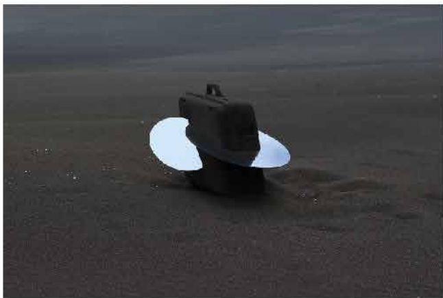
Rose des sables