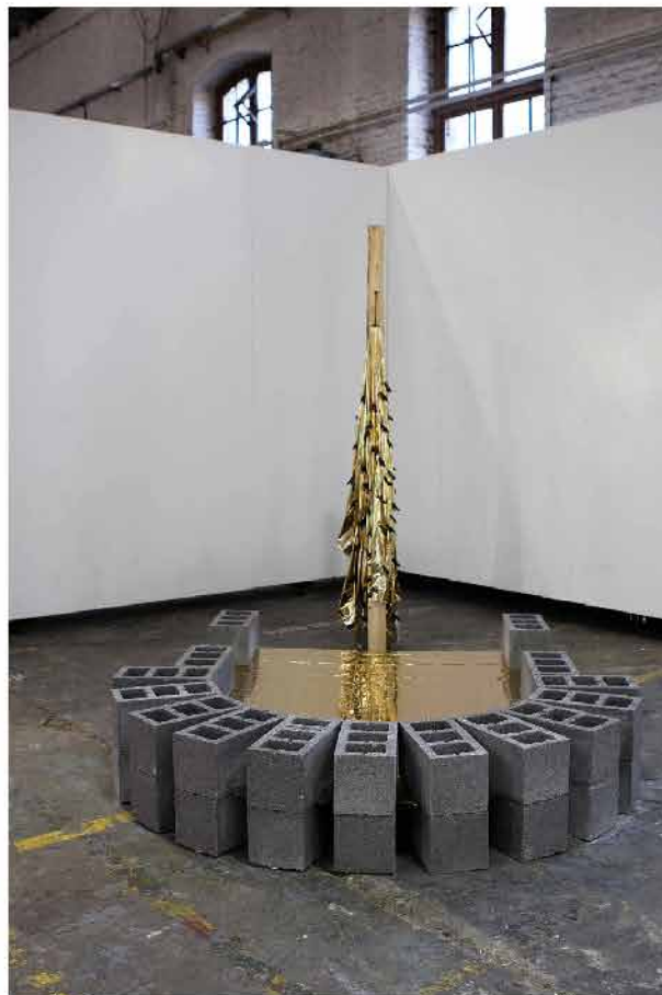
Le bruit du monde